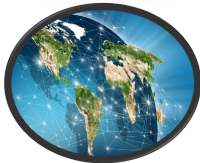
زيادة المبيعات و التصدير