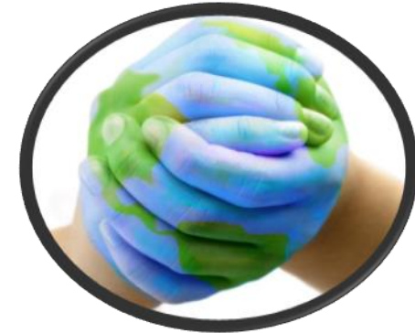
تقليل المخاطر البيئية